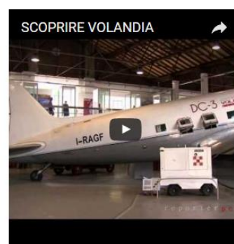
MUSEO DI VOLANDIA A SOMMA LOMBARDO -